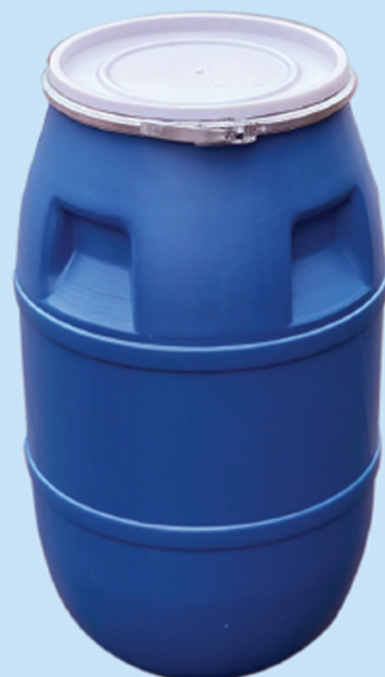
■ بشکه ۱۴۰ لیتر