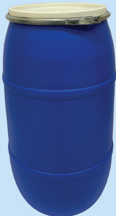
■ بشکه ۱۶۰ لیتری