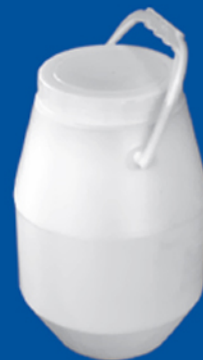
دبه ۲/۵ کیلوگرم پلمپ دار استوانه