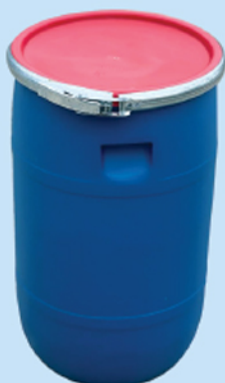
■ بشکه ۴۰ لیتر استوانه