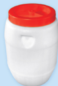
■ بشکه ۱۰ لیتر