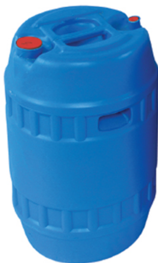
■ گالن ۷۵ لیتر