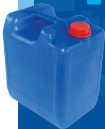
■ گالن ۲۰ لیتر چهار گوش