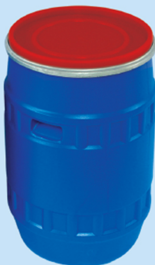
■ بشکه ۷۵ لیتری