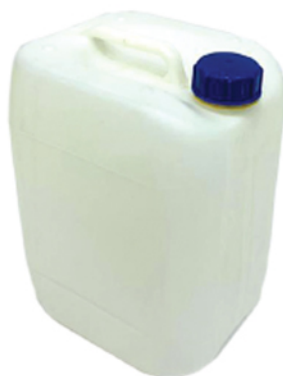
■ گالن ۱ لیتر