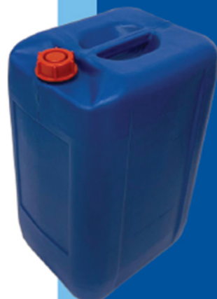
■ گالن ۶۰ لیتر