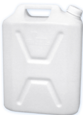
■ گالن ۲۰ لیتر کتابی