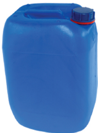
■ گالن ۲۰ لیتر - ۲۰۰۶