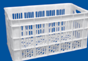
سبد ۲۰ کیلوگرم میوه