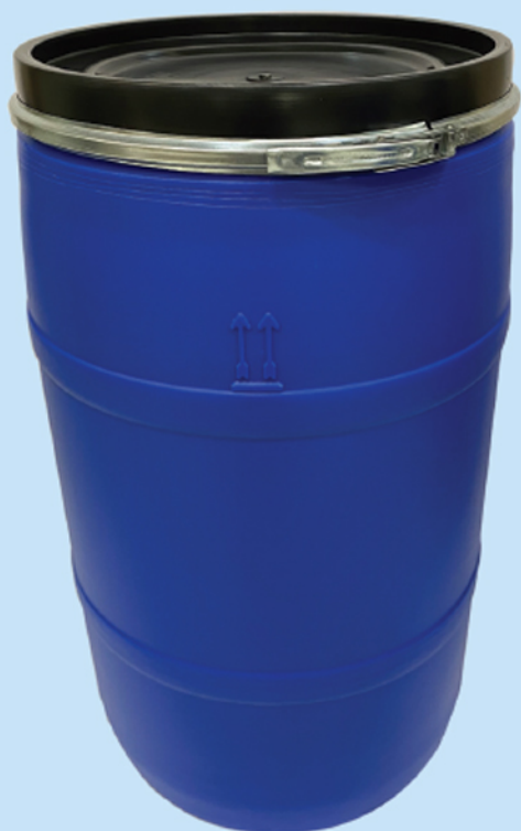
■ بشکه ۲۲۰ لیتری