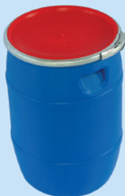
■ بشکه ۴۰ لیتری