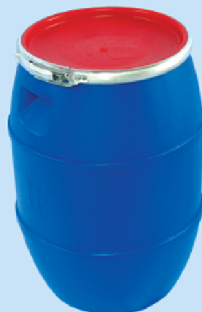
■ بشکه ۶۰ لیتری