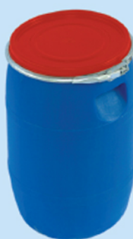
■ بشکه ۲۰ لیتر ۲۰۰۰