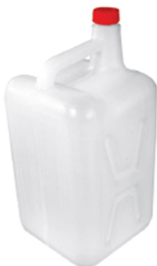
■ گالن ۱ لیتر