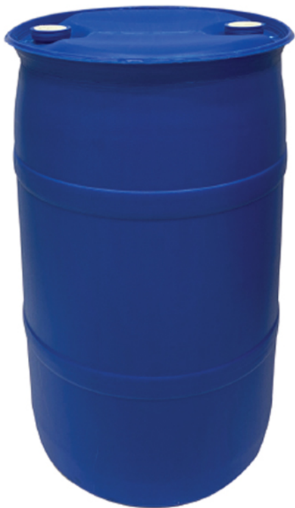
■ گالن ۲۲۰ لیتر