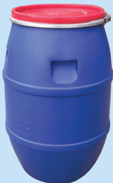
■ بشکه ۱۲۰ لیتری